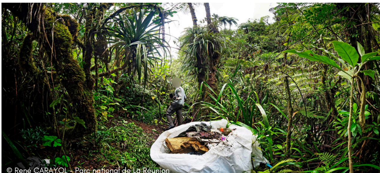
© René CARAYOL - Parc national de La Réunion

RIVIERE DES ROCHES - RIVIERE DE L'EST - ILET PATIENCE - HAUTS DE CAMBOURG - BRAS DES LIANES